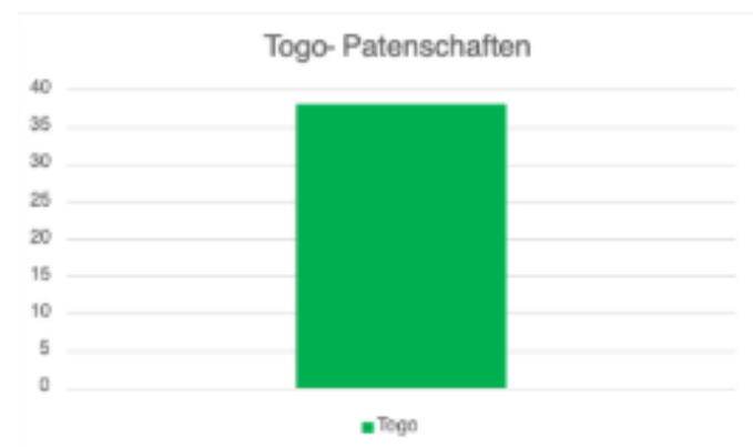
Abgeschlossene Patenschaften in Togo im Juli - September 2024.

Nach anfänglichen Schwierigkeiten Patenschaften in Togo zu vermitteln, hat inzwischen fast jedes Kind einen Paten gefunden. Durch den Zugang zu Bildung für circa 40 Kinder konnte eine Schule vor der Schließung bewahrt werden. Denn ohne Schüler wären die Gehälter für die Lehrkräfte gefährdet gewesen.